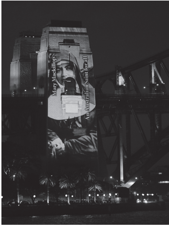
Cinq jours avant sa canonisation par le pape Benoît XVI, le 17 octobre 2010, des images de sainte Mary MacKillop (1842-1909), qui fonda les Sœurs de Saint-Joseph du Sacré-Cœur, furent projetées sur le pont du port de Sydney (voir pl. I)

universelle de l'aspiration religieuse, alors même que l'historiographie a longtemps présenté une ligne d'évolution de l'État et de ses projets marquée du sceau de la sécularisation. Les travaux des historiens du politique ont beaucoup dépendu de la sociologie de Max Weber, qui esquisse en 1917 le schéma du processus de « Entzauberung der Welt », que l'on peut traduire par l'expression « désenchantement du monde » qui est sans doute celle qui rend le mieux sa vision 2 . Ce processus de « démagification » est permis d'abord par l'affirmation du christianisme occidental, religion qui met au premier plan la transcendance de Dieu, restituant au monde une autonomie par rapport à la sphère du sacré. C'est le culte des saints qui permet d'abord, selon Weber, de libérer le monde de la présence encombrante des démons et des esprits, les miracles étant