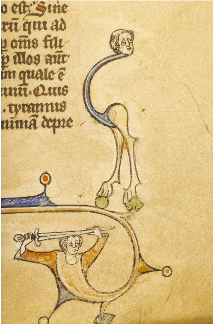
Fig. 7. Speculum historiale , fin du XIII e siècle, nord de la France, « Hybrides anthropomorphes » (Boulogne-sur-Mer, bibliothèque municipale)