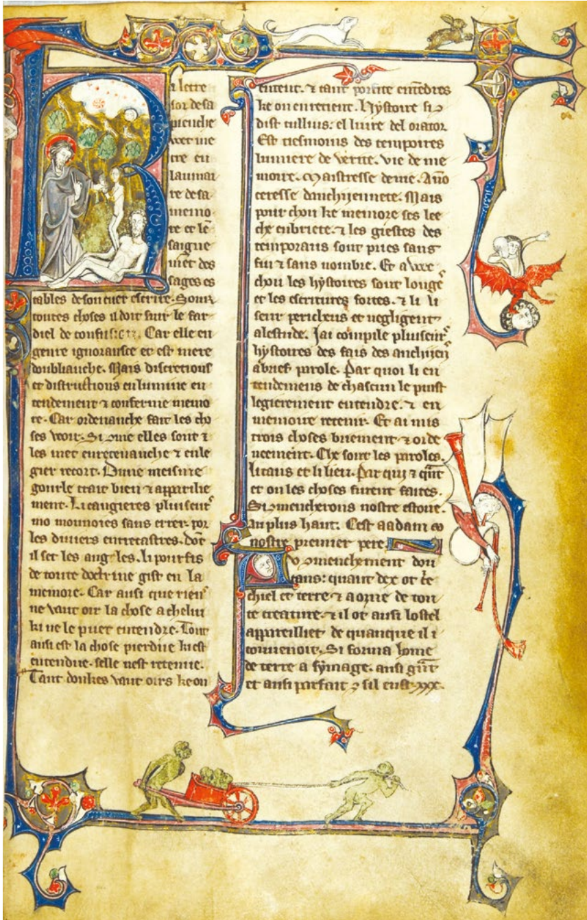
Fig. 4. Chronique dite de Baudouin d'Avesnes , fin du XIII e siècle, nord de la France, « figures marginales encadrant le texte » (Arras, médiathèque)