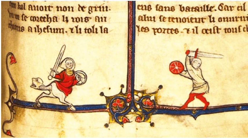
Fig. 8. Chronique dite de Baudouin d'Avesnes , fin du XIII e siècle, nord de la France, « Combat entre une femme hybride et un homme » (Arras, médiathèque)