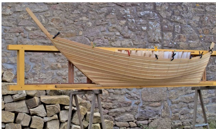
Fig. 1. Le modèle physique à son achèvement

les ordinateurs, excepté les stations de travail, ne pouvaient en traiter. Pour réduire la taille du fichier de plus de 4 Go, certains points ont été numériquement retirés sans prendre en considération leur position par rapport aux données nécessaires. Le fichier final était totalement inexploitable, puisque les chants des virures n'étaient pas spécifiquement relevés et impossibles à reconstituer. Le modèle numérique fut créé à partir de la maquette par des mesures manuelles. La face interne de chaque virure fut relevée au niveau des couples réguliers et transférée dans le logiciel Rhinoceros . Dès que le bordé fut modélisé, la charpente, le vaigrage et les baux furent reconstruits suivant les données d'origine provenant des sections, des relevés en développé issus des minutes sous-marines et à l'échelle 1/1.