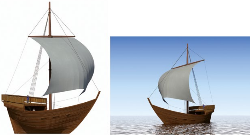
Fig. 4. Reconstitution hypothétique du navire sous voile. À gauche : la coque reconstituée avec le château arrière. À droite : le navire proche de sa ligne de flottaison en charge maximum