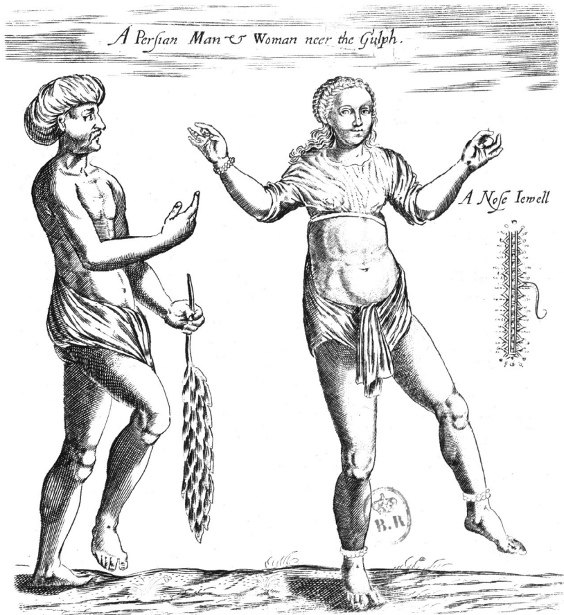
Ill. 32. « Homme et femme de Perse », dans Herbert, Some Years Travels into divers part of Africa [...] , 1677

Voyages du chevalier Chardin en Perse et autres lieux de l'Orient , Paris, Le Normand, 1811, t. VII, p. 285-286 ; 334 ; 339-340.