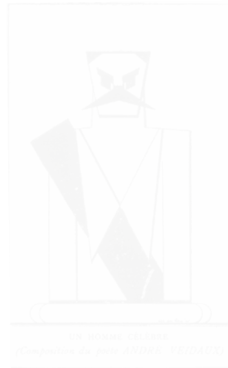
Fig. 117. André Veidoux, Un homme célèbre , composition du poète André Veidoux, La Plume (Paris), n° 156, 15 octobre 1895, Genève, Slatkine reprints, 1969, p. 480, BnF/ Gallica