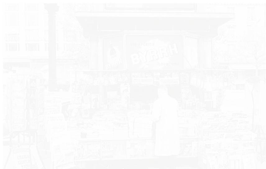
2. Le Kiosque à journaux en 1964, hors-texte dans René de Livois Histoire de la presse française : II. De 1881 à nos jours Lausanne, Éditions Spes/Paris, Société Française du Livre, 1965, t. II, p. 592-593 (voir cahier couleur I, pl. Ib)