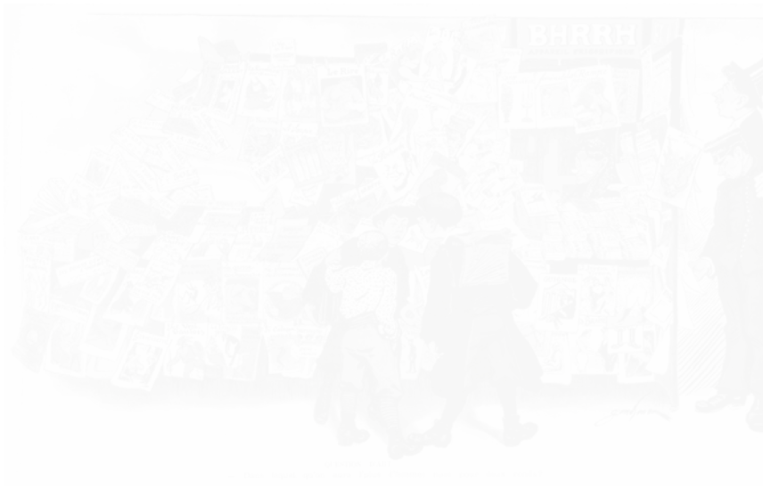
1. Jules Grandjouan, dessin paru dans le numéro spécial « Un peu de Publicité » entièrement réalisé par Grandjouan, Le Rire , 8 e année, n° 406, 16 août 1906, p. 8-9, coll. part. (voir cahier couleur I, pl. Ia)