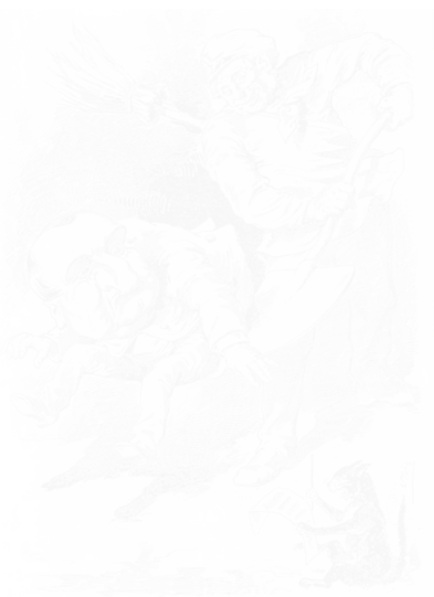
Fig. 114. Uzès, L'Appel au peuple – Tiens ! la v'là la pelle au peuple ! Le Chat noir (Paris), n° 55, 27 janvier 1883, Centre Charles Peguy, Orléans

Dans le prolongement de ces exemples, et dans la lignée de ce qu'ont fait les Incohérents, il faudrait citer le jeu de mots pictural, très en vogue à L'Hydropathe et au Chat noir . Ainsi Hope représente le pape sous la forme d'une cruche avec ce commentaire « sa majesté pot de vin » 78 . Le caricaturiste Uzès propose un calembour – « l'appel au peuple » (fig. 114) – qu'il associe à la caricature d'un ouvrier chassant les dirigeants de la III e République à coups de pelle. Cabriol croque Alphonse Allais 79 préparant une décoction de revues préconisées en « usage ex-terne » pour lutter contre la grisaille de l'esprit bourgeois. Ces illustrations articulent texte et image autour d'un message implicite qu'il faut lire au second ou au troisième degré. La gaieté caractérise en effet ce double langage qui est un amusement de l'esprit, une mascarade des mots qui se griment comme des comédiens dans les rôles de travestissement.