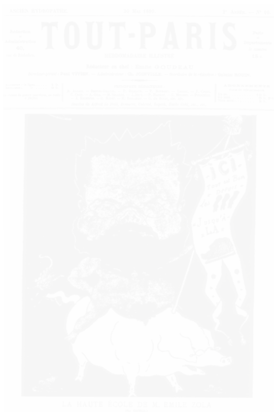
Fig. 110. Sapeck, La Haute École de M. Émile Zola, Tout-Paris [nouveau titre pour L'Hydropathe ] (Paris), n° 10, 30 mai 1880, Genève, Slatkine reprints, 1971

L'image est ensuite célébrée dans le texte même. Les tendances et les écoles artistiques du moment se retrouvent dans une majorité de textes poétiques. Une iconographie japonisante se développe dans les revues bohèmes sous le crayon de George Auriol et de Steinlen dans Le Chat noir , d'Henry Detouche dans Panurge , de Léon Lebègue et de Félix Régamey dans La Plume. Le Décadent , qui n'est pas illustré, évoque l'art extrême-oriental à l'occasion de quelques poèmes de Laurent Tailhade. Les couleurs diluées et pastels de son « Aquarelle japonaise » témoignent d'un rapprochement mimétique des techniques :