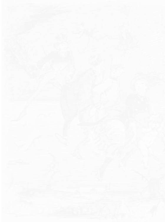
Fig. 112. Adolphe Willette, La Rentrée à Paris, Panurge (Paris), n° 1, 1 er octobre 1882, p. 1 médiathèque Michel Crépeau, La Rochelle