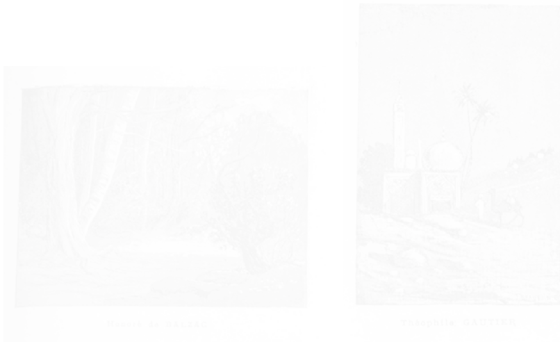
Fig. 111a et b. Jean Beauduin, Paysages littéraires , vignettes, supplément à Panurge (Paris) n° 22, 25 février 1883, médiathèque Michel Crépeau, La Rochelle

ruades et cavalcades désespérées. Les actes meurtriers et suicidaires du personnage fumiste viennent contraster avec l'apparente légèreté du style, comme dans les récits graphiques signés Willette où Pierrot finit par se pendre 60 après une succession d'actions drôles menées tambour battant, ou bien dans Avant le Bal 61 de Gorguet où, après maintes péripéties, un homme ne trouvant pas à se costumer finit par se tuer d'un coup de sabre. De la chanson populaire et satirique, les artistes retiennent la mécanique des émotions, la blague canaille, les éructations. Les images grivoises (femme en déshabillé ou décorsetée, modèle nu, scène suggestive d'allumage de cigare 62 ) ou scatologiques (personnages foulant des défécations ou clysopompe employé comme remède aux maux intestinaux 63 ) sont directement inspirées des brèves de comptoirs qu'apprécient tant les revues 64 .