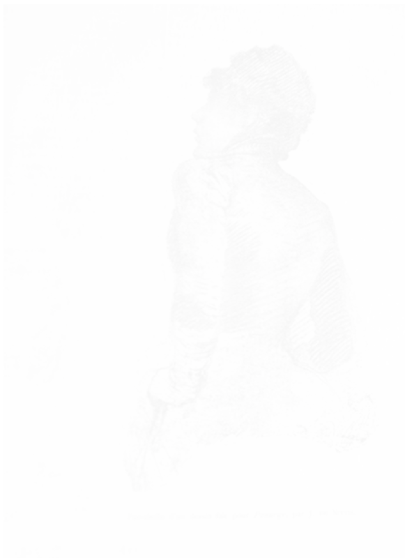
Fig. 115. Joseph de Nittis, fac-similé d'un dessin fait pour Panurge (Paris) n° 16, 14 janvier 1883, p. 5, médiathèque Michel Crépeau, La Rochelle

Parallèlement, les revues privilégient dans leurs colonnes des textes qui donnent l'impression d'être créés sur l'instant, qui sont ou qui simulent le fait d'être inachevés. Le croquis et l'ébauche sont transposés dans le domaine littéraire. La série des « Croquis à la plume » 85 de Raymond d'Abzac en est un exemple, mais l'on pourrait citer également « Deux croquis » 86 d'Émile Soinet, « Nocturnes selon Paris » 87 d'Harold Swan dans La Plume , « Photographie instantanée » 88 d'Ernest Laumann, « Croquis (Place Pigalle) » 89 de Bayevent Sansoucy, « Croquis funèbre » 90 d'Adolphe Vautier, parus dans Le Chat noir ,