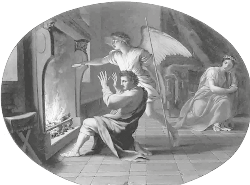
7. Eustache Le Sueur, La Nuit de nocces de Tobie , Paris, coll. BNP-Paribas