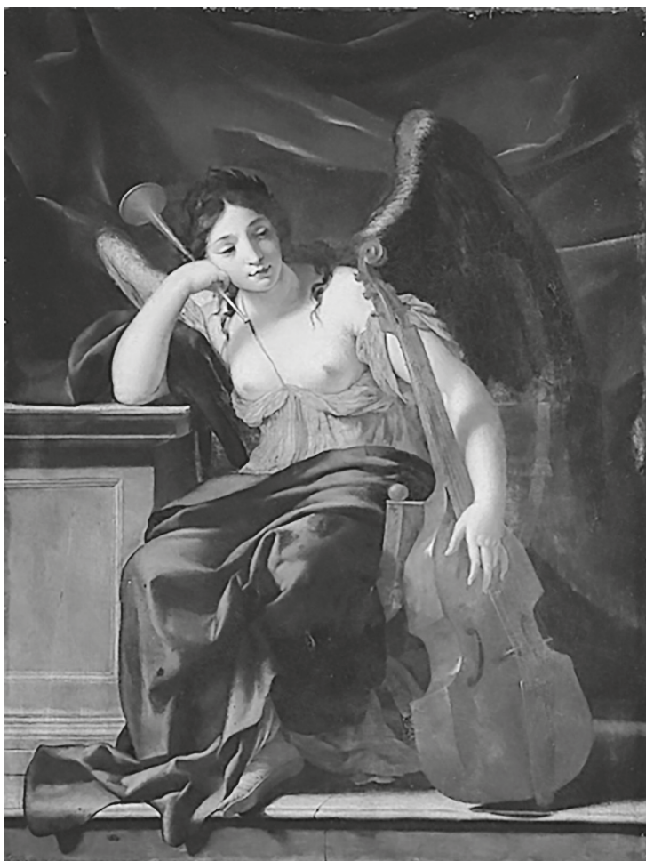
1. Eustache Le Sueur, Allégorie de la Poésie (avec l'aimable autorisation de Noortman Master Paintings)

était anonyme, mais la tradition familiale des propriétaires indiquait son ancienne provenance : l'hôtel Lambert, à Paris.