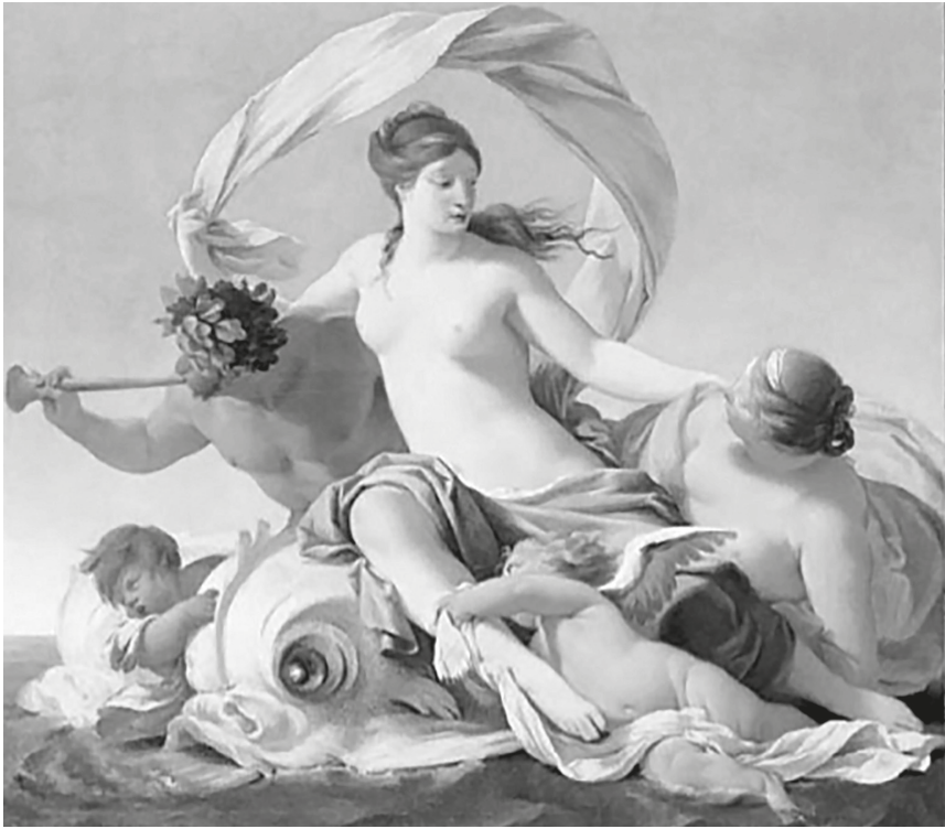
6. Eustache Le Sueur, Triomphe de Galatée , Sceaux, coll. Milgrom