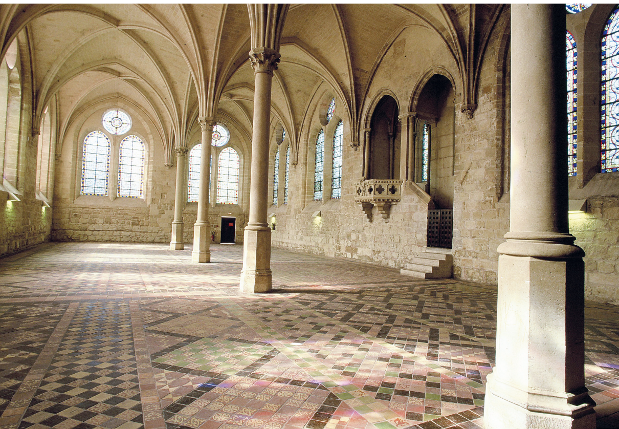
Le réfectoire de l'abbaye de Royaumont